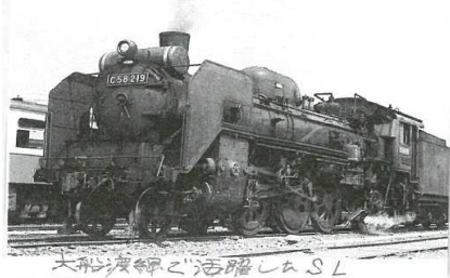
大船渡線と活躍したSL

は現在の細浦駅の南東側に作られその都度、蒸気機関車を一関方面(上)に折り返し転換するため、転車台にのせ機関士や駅員達が人力で取手を押し、回転させる作業があった。大船渡線で車輛を牽引する