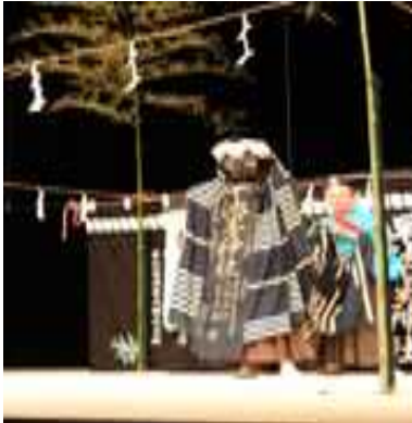
早池峰神楽の権現舞

早池峰神楽や黒森神楽等の神楽系の幕柄は、黒色あるいは紺色の地に白いボーダー柄になっています。これについてはまだ解明できていません。